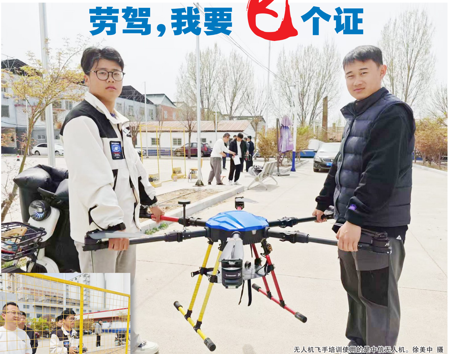
无人机飞手培训使用的是中信无人机。