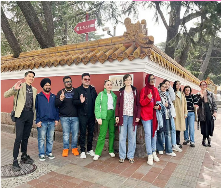
国际友人在大学路网红墙前合影。