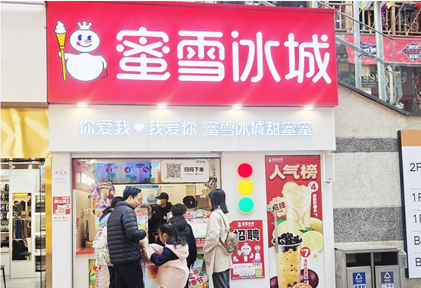
蜜雪冰城门店。

对蜜雪冰城被曝光食品安全问题,网友表现出两极分化。有的网友表示,“四块钱能喝到真柠檬水,知足了”“为