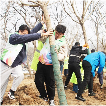
新栽树吃上营养土、喝起再生水。

“两创”植树节特别活动。大学生志愿者与村民自发结成“忘年组”,栽种了30余棵樱珠黄蜜树和改良大樱桃树。 崂山区自然资源局向全区广大居民和社会各界发出了全民义务植树倡议书,弘扬绿色文化,引导更多人加入到绿色行动中,用实际行动宣传植树造林的重要性和必要性。 崂山风景名胜管理局在流清小平岚区域组织开展义务植树活动,党员干部、职工代表等70余人参加。经过一上午的劳作,共栽植红楠、花楸、野茉莉等400余株,并挂牌20余个。 崂山区城市管理局组织党员干部前往虚拟现实产业园北侧山头公园,开展“植树添新绿 共建美家园”主题党日活动,积极践行“绿水青山就是金山银山”的理念,为建设美丽崂山贡献自己的力量。 (观海新闻/青岛晚报/掌上青岛 首席记者 张译心 通讯员 周义晶 王浩 侯昕)