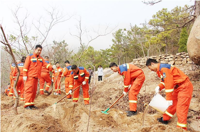
崂山风景区护林防火队员开展春日植绿行动。

本报3月12日讯 12日,崂山区全区联动,社会各界广泛参与,共同开展了一系列丰富多彩的植树节活动。大家以实际行动践行绿色发展理念,为崂山增添了一抹抹新绿,共绘一幅幅生动的生态画卷。 金家岭街道在午山二小区西侧广场开展植树活动。大家分工明确,合作默契,从挥锹挖土、培土浇水到加固树苗,一气呵成,种下20棵碧桃树和85棵山胡椒树。 中韩街道爱丁堡社区文明实践站与山东实华天然气有限公司联合举办了植树节活动,共种植50株树苗,涵盖桂花、月季等品种。参与活动的居民兴奋地说:“能亲手种下小树苗,感觉特别有意义。” 沙子口街道组织党员干部、护林员、志愿者等在福海园开展义务植树活动,为街道增绿添彩。大家三五成群,挥锹铲土、扶苗填坑、提桶浇水。专业人员及时进行了全面检查和养护,确保树苗的成活率,共种下白皮松、女贞等各类苗木300余株,为街道增添一片“党建同心林”。