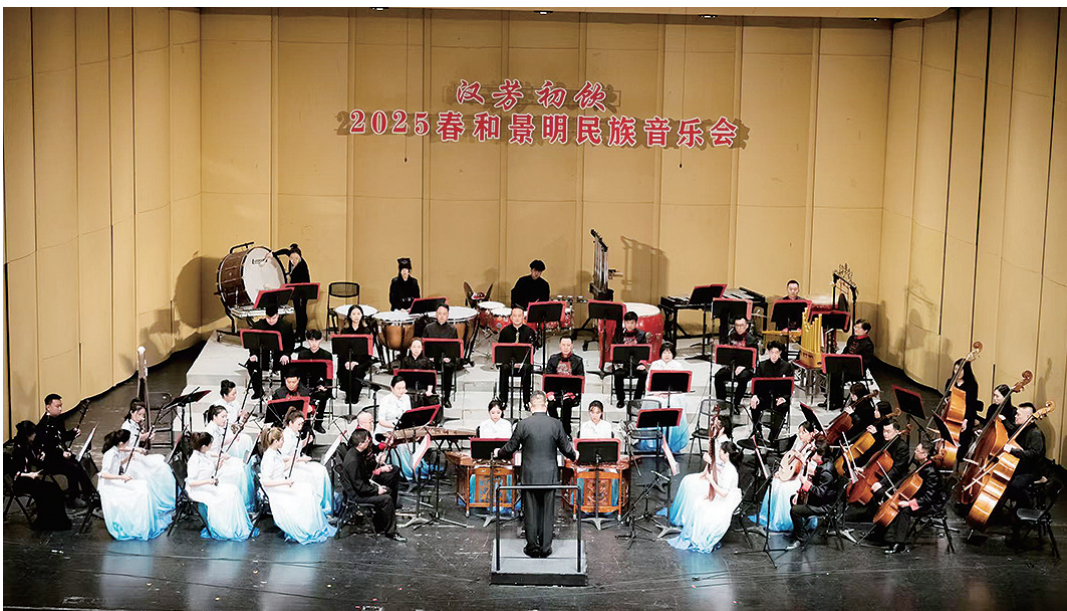
“春和景明” 2025春和景明民族音樂會