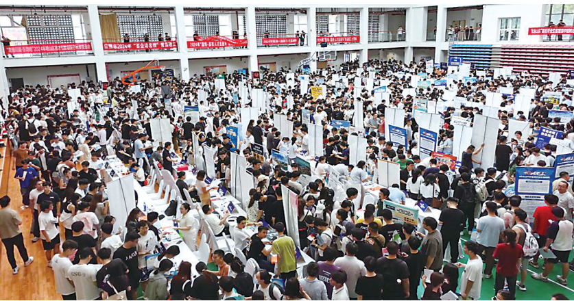
崂山区招才引智名校行。(资料照片)

崂山区创新建立人才匹配平台,利用双选会、组团招聘会、定向招聘活动等多种途径,设立人社免推服务专区,采集应届高校毕业生求职简历,基于AI大模型DeepSeek的智能算法,主动为辖区用人单位开展精准的岗位匹配工作,提高引才匹配效率,推动人才与城市发展深度绑定,实现“人岗相适、业业共兴”。