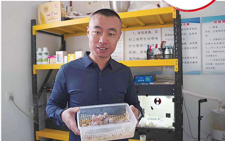
刚破壳不久的和尚鹦鹉雏鸟。