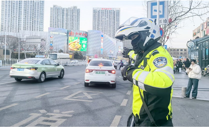
交警在乐客城西门前的夏庄路上疏导交通。

夏庄路门前的公交站附近新增了一处监控。除此之外,夏庄路上还专门施划了分道线,辟出最外侧的公交车专用车道。“我们把最外侧的道路设置成公交车专用道,只允许公交车车辆通行,其他车辆不得进入专用车道内行驶。车经这一路段的车辆,要在借道区域范围内驶出专用车道。”李沧交警大队民警告诉记者,监控已于1月13日正式运行,专门抓拍违法驶入公交车专用道或在专用道违停候客的车辆,依据《道路交通安全法》相关规定给予罚款100元的处罚。启用前,交警已通过各种方式向社会公布。