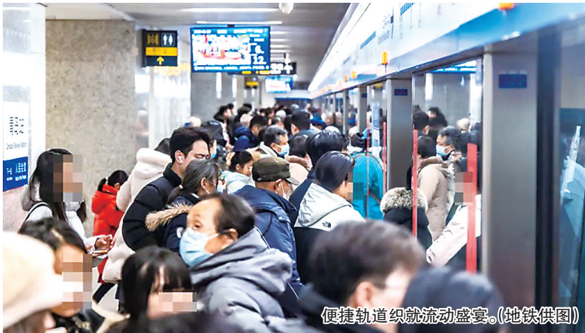
便捷轨道织就流动盛宴。

此外,夜经济持续繁荣。春节期间青岛多个景点夜间消费活跃,浮山湾灯光秀、明月·山海间不夜城、方特梦幻王国有着强大吸引力,红岛火车站、红岛科技馆(方特)、五四广场地铁站最大单日客流分别较日常周末增长约150%、15%、7%。轨道交通成为夜经济的“重要纽带”。