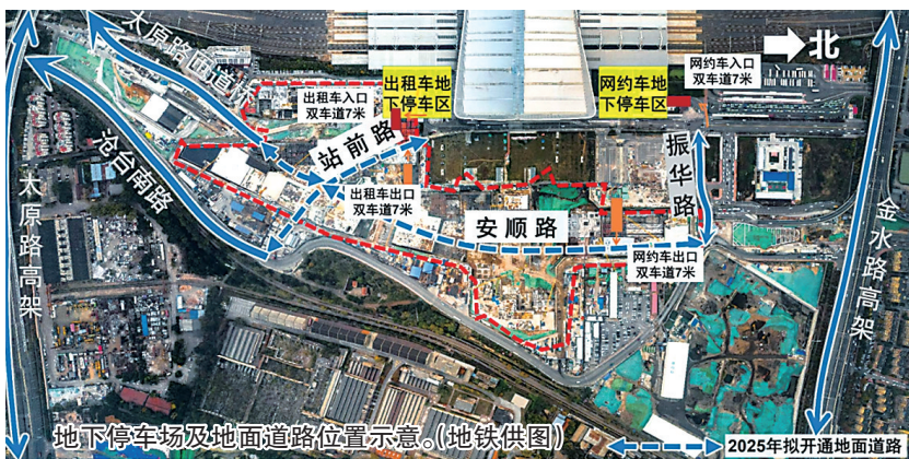
地下停车场及地面道路位置示意。

本报2月16日讯 作为市办实事之一,青岛北站东广场地下停车场及地面道路一体化项目备受市民关注。16日,地铁集团公布了这件实事的“推进表”。