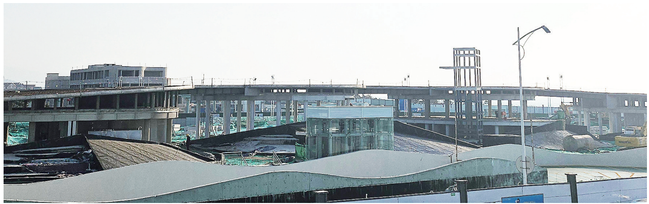
「麦岛云桥」展露初容。

海路、麦岛路路口北侧(麦岛金岸小区)、西侧(锦园小区)、南侧(麦岛停车场)和东侧(麦岛污水处理厂)分设ABCD四个出入口。每个出入口都将安装扶梯和直梯，方便市民进出地道。根据此前发布的公示，东海路麦岛路路口人行过街地道工程位于崂山区东海东路-麦岛路交叉口，建成后有效满足小麦岛公园、麦岛路西侧停车场日益增长的人流需求，实现人车分流，保障行人过街安全，缓解东海路、麦岛路交通拥堵问题。