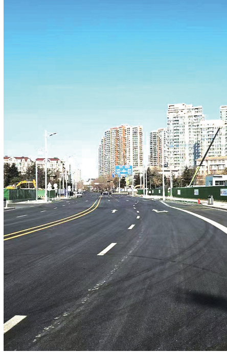
整修一新的麦岛路。