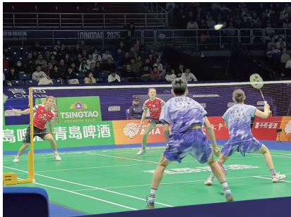
中国队小组赛对阵新加坡。

亚洲羽毛球混合团体锦标赛首次落户中国内地，云集了亚洲顶尖队伍，球员阵容鼎盛。青岛高度重视赛事筹办，成