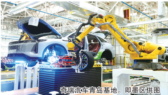
奇瑞汽车青岛基地。

即墨区把改革创新作为破局发展困境、激活发展潜能的关键一招。在刚刚过去的2024年,即墨区扎实推进省委、市委217项改革要点任务、系统谋划实施232项区级改革任务不断激发内生活力、塑造高质量发展新优势。 2025年,即墨区凝聚共识,将围绕培育新质生产力、经略海洋、改善民生等中心工作,突出抓好国资国企、农村集体“三资”管理等重点体制机制改革,探索建设新型社会治理体系、优化基层卫生服务模式、完善招商引资工作机制等自主创新改革事项,以改革实效为高质量发展提供强大动力和制度保障。 2025年,即墨区将抓住招商引资、社会治理、功能区、农村发展等关键领域,下大力气破冰突围、全力啃下硬骨头。聚焦教育、医疗、住房等领域,推出更多务实改革举措,把“问题清单”变成“幸福账单”。