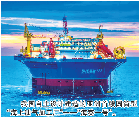
我国自主设计建造的亚洲首艘圆筒型“海上油气加工厂”——“海葵一号”。

冬日的唐岛湾湿地公园,蓝湾绿道宛若玉带蜿蜒,黑天鹅、绿头鸭、斑背潜鸭等成群的水禽自在徜徉,一幅海天相接、云浪共舞的生态画卷令人神往。 好生态就是“金饭碗”。新区以市场为导向,探索形态多元的金融创新