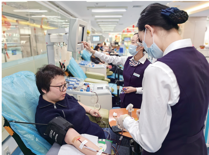
2024年3月，青岛市中心血站内，市民在献血。