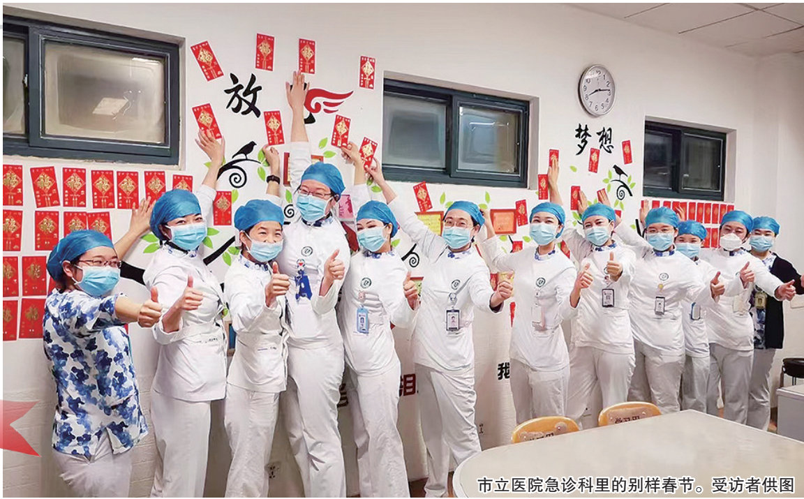
市立医院急诊科里的别样春节。

提 到春节,多数人想到的就是阖家团圆,抛却平时工作的繁忙,回到家中与家人们欢聚一堂。当千家万户沉浸在团圆与喜悦之中时,青岛市各大医院的医护人员却放弃了与家人团聚的温馨时光,选择坚守在岗位上。他们的身影忙碌而坚定,诠释了医者的责任与担当,为患者的健康与安全筑起了一道坚实的防线,用实际行动诠释了“医者仁心”的深刻内涵。春节期间,市立医院急诊科、妇儿医院产科、康复大学青岛中心医院肿瘤科的医护人员,以一种不同寻常的方式度过了这个特殊的节日,他们用责任和爱心,为患者的健康保驾护航,成为节日里最温暖的守护者。