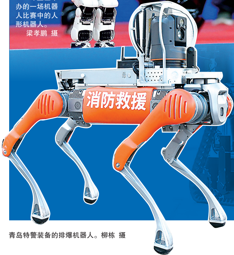
青島特警装备的排爆机器人。

从春晚舞台到贺岁档电影,这个春节,机器人元素满满。在青島的医院里,机器人能完成肺脏移植微创手术;在一汽-大众青島分公司的生产车间,工业版人形机器人已开始“实训”……机器人不仅“用在青島”,而且开始“产在青島”,“研在青島”。