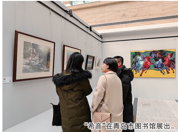
“希音”在青岛市图书馆展出。

品，“希音”还展示综合材料、数字艺术、装置艺术等带有科技属性的艺术形式，极大丰富了展览的内涵。