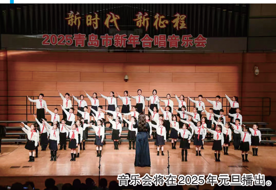
音乐会将在2025年元旦播出。

丝竹悦耳迎新岁，歌声嘹亮展宏图。由中共青岛市委宣传部、青岛市文化和旅游局、青岛市文学艺术界联合会、青岛市广播电视台主办的“新时代，新征程”2025青岛市新年合唱音乐会27日在青岛大剧院隆重举行。