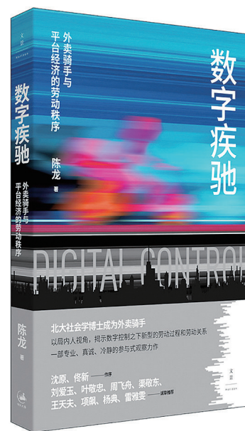
《数字疾驰》陈龙 著 上海人民出版社 2024年12月出版

结合参与式观察经验和劳动社会学理论研究，陈龙向我们揭示：随着科技的进步，资本对劳动控制强