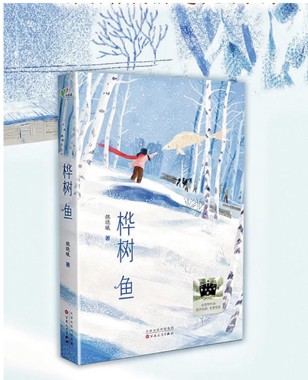
《桦树鱼》魏晓曦 著 百花文艺出版社 2024年12月出版

“我独自坐在海边，看潮起潮落，怀念森林里的风。”青岛儿童文学作家魏晓曦，把这份怀念，用五年时间，写出了一本《桦树鱼》，深入小兴安岭南麓，回溯一段七十多年的历史，探寻关于生命、自然、成长的主题。