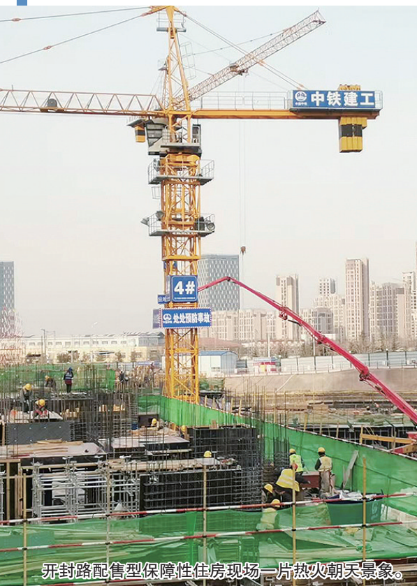
开封路配售型保障性住房现场一片热火朝天景象。