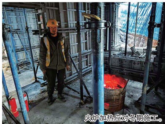
火炉加热应对冬期施工。