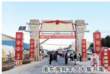
港东海鲜年货大集开集。

开设了免费班车,提供接送服务,每天从早上八点半至下午三点半,每半小时一班,确保市民能便捷地抵达年货大集现场。