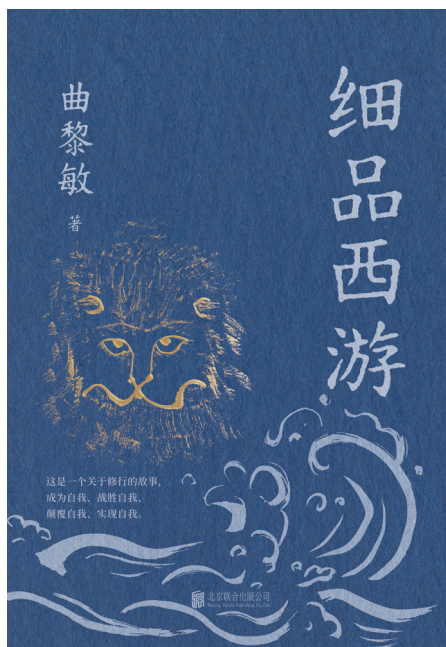
《细品西游》 曲黎敏 著 长江新世纪|北京联合出版有限公司 2024年12月 出版