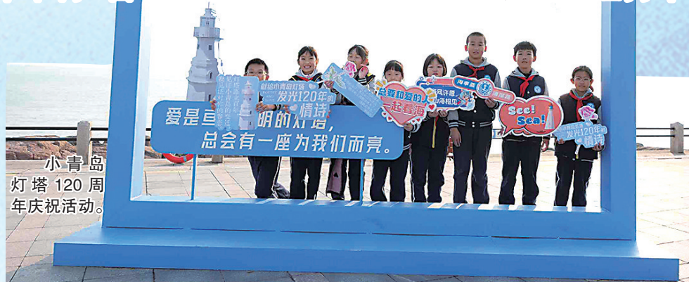
小青岛灯塔120周年庆祝活动。

“小青岛灯塔台词框”“琴屿飘灯明信片”“灯塔邮筒”……20日下午，记者在小青岛灯塔广场看到，慕名而来的市民和游客举起手机，将山海一色框入“爱是亘古长明的灯塔，总会有一座为我们而亮”的台词框中；拿起彩笔，在明信片上写下对小青岛灯塔的