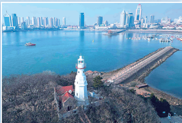
航拍小青岛灯塔。