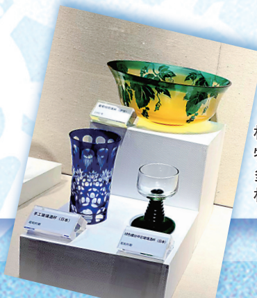
个杯堂杯子博物馆有多种多样的精致杯子。