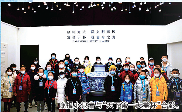
晚报小记者与“天下第一盖杯”合影。

府部门的支持和引导。2024年印发的《崂山区鼓励非国有博物馆发展扶持管理办法》,经综合评价90分以上(含90分)补助标准20万元/年,80分—90分(含80分)补助标准15万元/年,70分—80分(含70分)补助标准10万元/年,被国家文物局评估定级的非国有博物馆给予一次性奖励,一级馆奖励150万元、二级馆奖励100万元、三级馆奖励50万元。