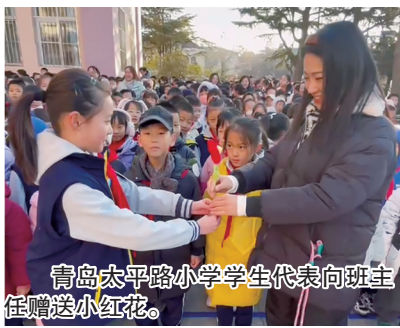
青岛太平路小学学生代表向班主任赠送小红花。

本报12月18日讯 为营造尊重、关爱班主任的良好风尚,助力学生幸福成长,日前,“追光有我 与爱同航”青岛