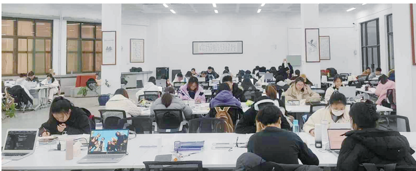
青岛大学图书馆中正在积极备战考研的学生们。

相比本科阶段,研究生学习更加专业化,能让同学们更清晰地认识到自己的兴趣、能力和职业发展方向。图书馆的角落里、教学楼的教室里,都是他们埋头苦读的身影。考研之路是一段充满迷茫与突破的旅程,许多考研学子从最初的无所适从到逐渐找到节奏,经历