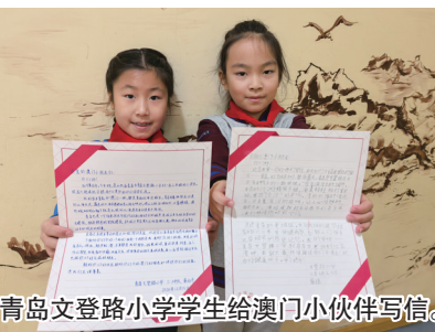
青岛文登路小学学生给澳门小伙伴写信。

本报12月18日讯 近日,青岛文登路小学开展了“心系澳门,同庆回归”活动。主题队会上,中队辅导员通过生动的讲解,带领同学们一同深入学习了澳门的回归历程以及回归后的繁荣发展,营造出浓厚的活动氛围,让大家感受澳门的独特魅力。学生们选择用书信的方式,向澳门小伙伴介绍自己的家乡青岛,讲述身边的故事,字里行间洋溢着真诚与友善。他们期待通过信件跨越地域的界限,与远方的小伙伴建立起深厚的友谊,促进文化的交流与融合。