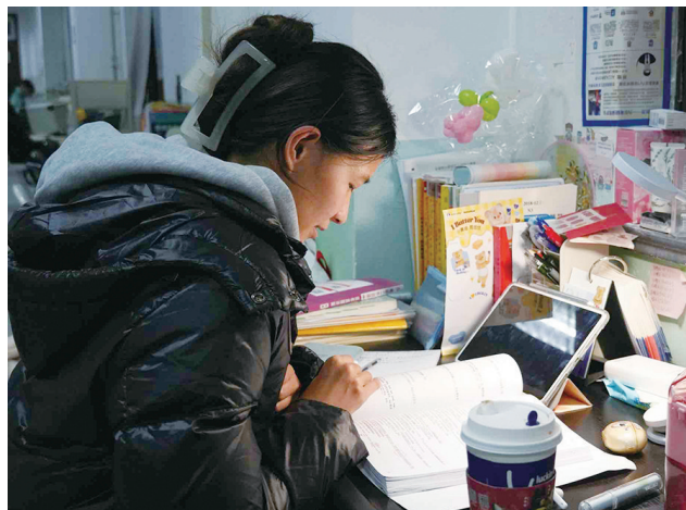
最后冲刺阶段,考生查漏补缺。

随着考试进入倒计时,时间仿佛被按下了快进键,每一天都显得尤为珍贵。据了解,2025年考研报名人数388万人,比2024年下降50万人,这是近十年来第二次连续下降。虽然报考人数减少,但是考生们的热情不减。