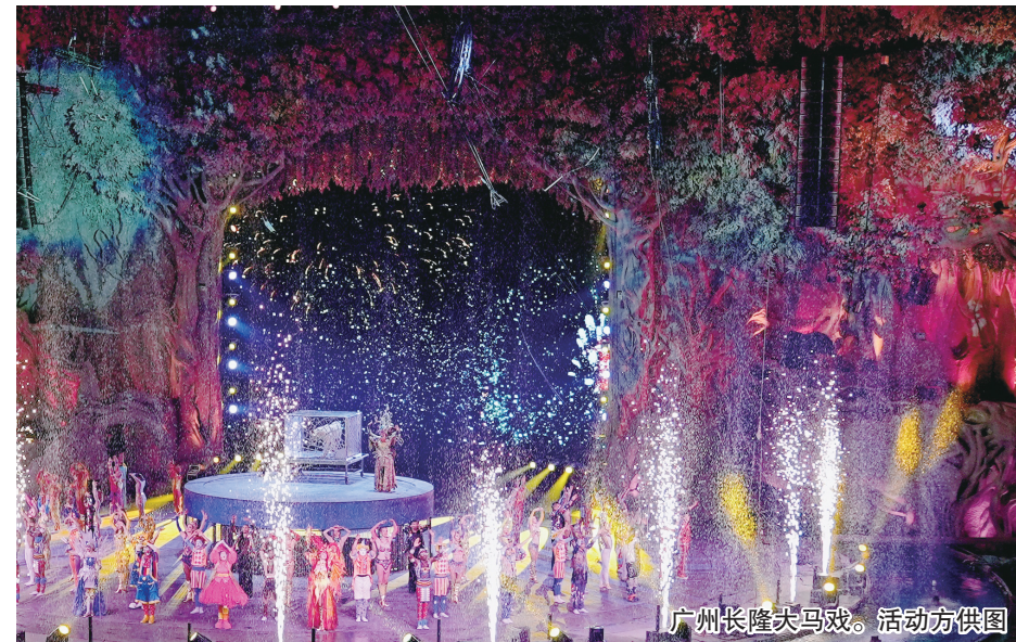
广州长隆大马戏。活动方供图