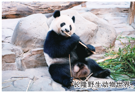
长隆野生动物世界。