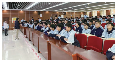
八年级男生专题讲座在学校举行。

本报12月18日讯 12月9日下午，青岛39中市北分校在学术报告厅成功举办八年级男生专题讲座。学生处主任围绕“我能抽烟吗？我会处理好冲突事件吗？我真的会手机成瘾吗？我可以谈恋爱吗？”四个贴近初中青春期男生生活的问题展开，旨在通过深入讨论与引导，帮助学生们树立正确的价值观和行为准则。此次活动不仅让学生们对青春期有了更深刻的认识，也展现出学校关注学生青春期健康成长方面的坚定决心和实际行动。今后，学校将继续全方位关注学生，将青春期健康教育和法制教育贯穿于学校教育始终，为学生们健康成长、立志成才提供有力保障。（观海新闻/青岛晚报/掌上青岛 记者 于娜）