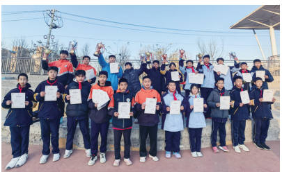
青岛市北中学初中部体育运动会为获奖學生颁奖。

本报12月18日讯 近日，青岛市北中学第三届“乘风破浪 奋勇激昂”冬季体育运动月火热启动，全校32个班160余名學生参赛，大家以班级为单位，在紧张而激烈的比赛中，不断超越自我追求卓越。