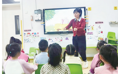
莱西市滨河幼儿园开展集体教育活动观摩研讨。

本报12月18日讯 为提高幼儿教师的专业发展水平，进一步落实《3-6岁儿童学习与发展指南》精神，全面提高教育理念与教学活动组织能力，夯实教学基本功，近日，莱西市滨河幼儿园开展了集体教育活动观摩研讨。