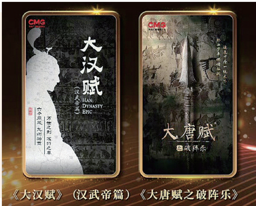
《大汉赋》(汉武帝篇) 《大唐赋之破阵乐》

中央广播电视总台2025“大剧看总台”电视剧片单发布活动在京举行,47部总台大剧及8大系列精品短剧亮相。片单分为“观匠心独运的传奇”“寻烽火岁月的印记”“品冷暖交织的人生”“探迷雾重重的真相”“赴披荆破浪的旅程”“踏合力同心的征途”六个板块。 “观匠心独运的传奇”中的《大汉赋》(汉武帝篇)、《大唐赋之破阵乐》尤为引人注目,历史正剧作为国产电视剧的重要组成部分,承载着厚重的文化使命。近年来,脍炙人口的历史正剧在荧屏有所缺失。此次的《大汉赋》《大唐赋》有望在荧屏再展历史风采。