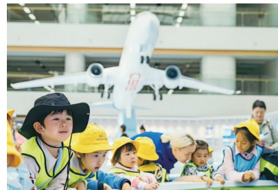
中国民航科普教育基地落户青岛机场。

本报 11 月 28 日讯 近日,青岛机场“民航博物馆青岛机场分馆科普基地”成功获评 2024 年度“中国民航科普教育基地”。该荣誉由中国民用航空局主管的中国民航科普基金会审议通过,是青岛地区首个以生产设施为主题的国家级民航科普基地。这一成就标志着青岛机场集团在传播民航文化、推动公众科普教育领域迈出了重要而坚实的一步。