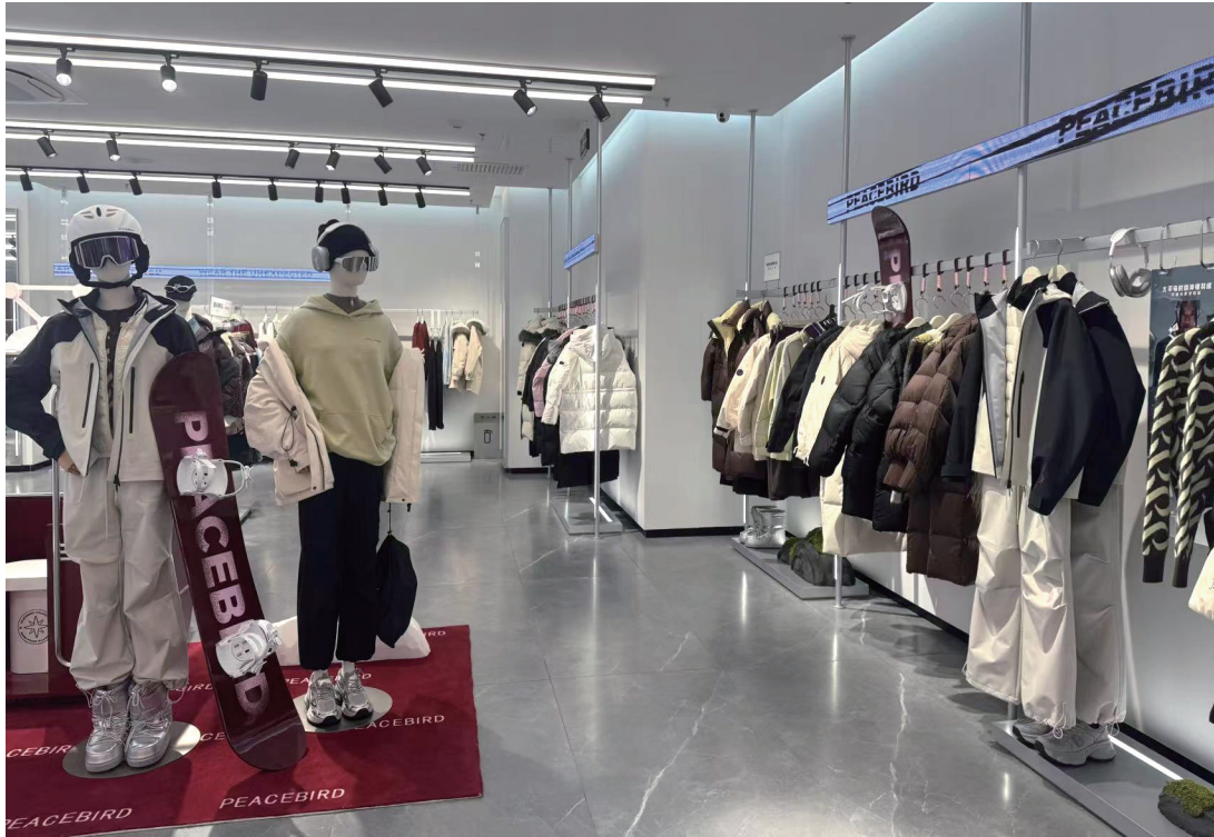
太平鸟台东利群店将冲锋衣、羽绒服等保暖服饰摆放在核心位置。

近日，岛城气温骤降，寒意逼人，却让冬季服饰市场迅速升温。各大商场和购物中心纷纷推出各类御寒服饰，羽绒服、保暖内衣和冲锋衣成为市民的首选。这个冬季，服饰消费背后蕴藏更多的“暖意”，不仅温暖了市民，也为城市经济注入了一股热流。随着滑雪季节的到来，冲锋衣的热销进一步推动了冬季服饰消费的增长。