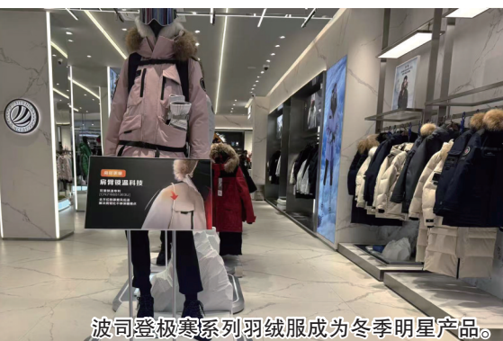
波司登极寒系列羽绒服成为冬季明星产品。

受到面料、设计、品牌溢价等因素的影响，不同品牌的冲锋衣售价差距较大。在万象城店记者了解到，定位市场高端领域的始祖鸟硬壳冲锋衣价格在4500元至9800元不等，定位中高端的北面经典款冲锋衣的价格则在1300元至3000元之间。相比之下，许多国产品牌的冲锋衣则凭借较为亲民的定价，成功打入了大众消费市场。国产品牌骆驼三合一冲锋衣售价不到500元，凭借其较高的性价比，获得了大量市民的青睐。