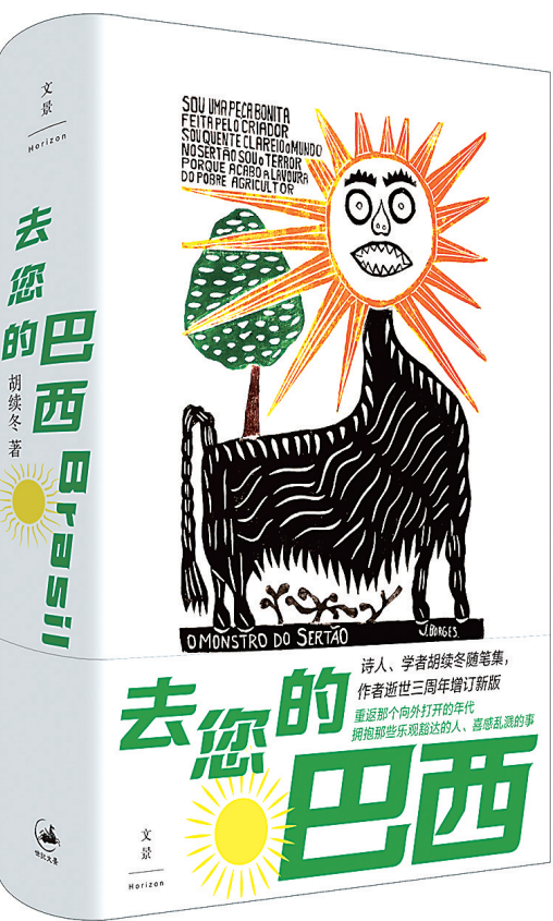
《去您的巴西》 胡续冬 著 世纪文景 上海人民出版社 2024年11月 出版

对大部分中国读者来说，巴西是一个遥远、陌生甚至有几分神秘的国度。即便在网络发达、短视频铺天盖地的今天，旅行类博主的巴西足迹也并不常见。但二十年前，有一位中国人，曾用自己生动、细密的笔触书写下真实的巴西——这个人就是已故的诗人、学者胡续冬。近日，他的随笔集《去您的巴西》出版。此书在旧版（旧版名为《去他的巴西》）基础上增加了新版序言和后记，还有作者初次到访巴西的二十年后重返巴西时写下的几篇文章。