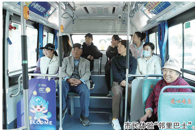
市民体验“邻里巴士”。

服务，利用微巴串联起社区附近的主干公交线路、地铁站、购物中心等地，实现“家门”“车门”“目的地”的便捷出行，构建全程15分钟的便民生活圈。