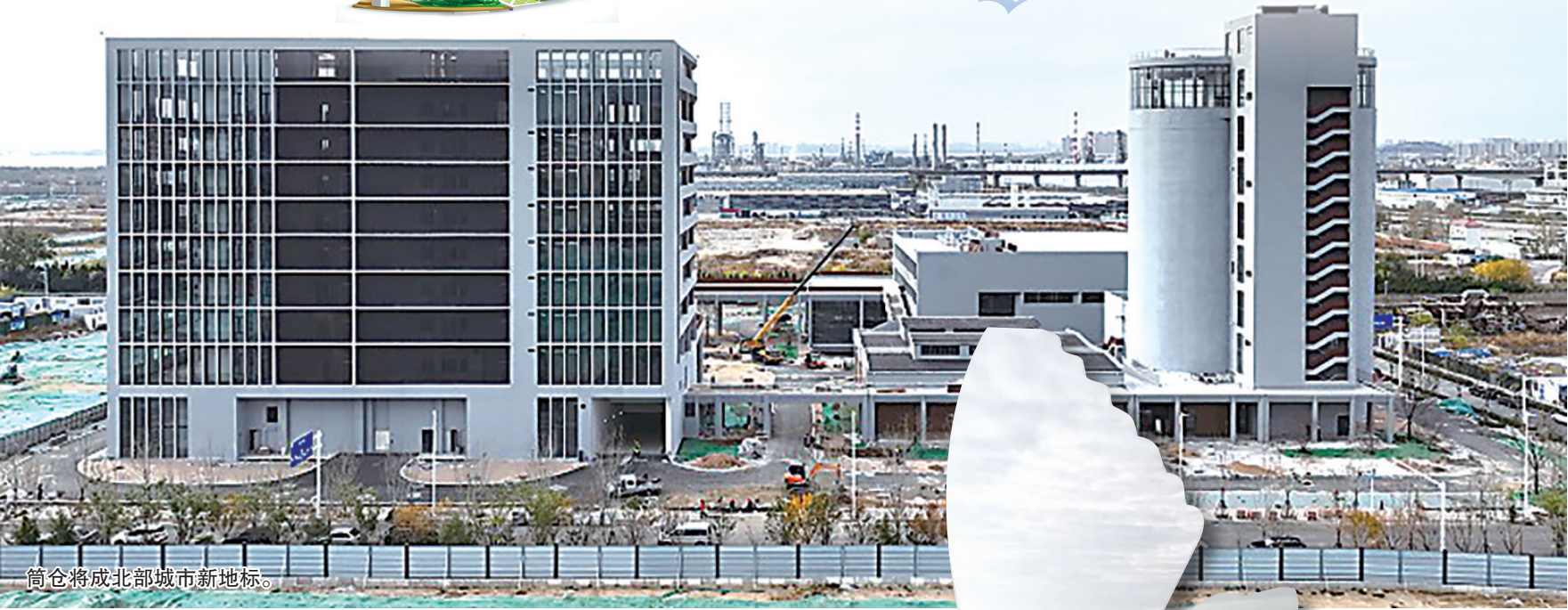
筒仓将成北部城市新地标。