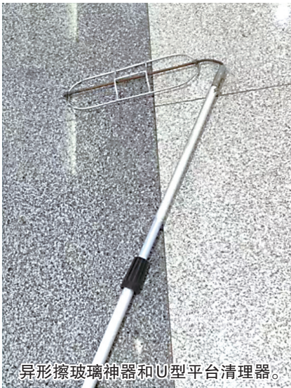
异形擦玻璃神器和U型平台清理器。

大家纷纷表示，这样的创新发明不仅提升了工作效率，还能在小立法中加分获得额外奖励，能在车站上推广自己班组的创新办法，让班组成员们感到非