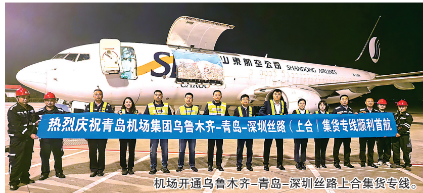
机场开通乌鲁木齐—青岛—深圳丝路上合集货专线。

本报11月17日讯 青岛机场近日正式开通乌鲁木齐—青岛—深圳全货机航线，该航线由山东航空执飞，采用737-800BCF型全货机，最大载量为18吨，是连通新疆、山东、广东三地的重要货运航线。作为青岛机场与乌鲁木齐机场、深圳机场“双枢纽”合作的重要成果，这一航线的开通，标志着青岛机场经新疆、深圳，连通共建“一带一路”国家和RCEP各成员国的枢纽作用持续提升。