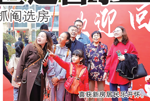
喜获新房居民乐开怀。