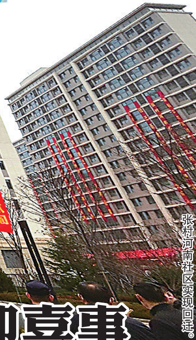
张村河南社区实现回迁。