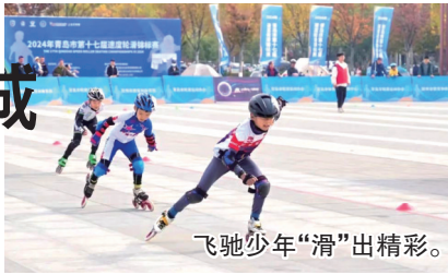
飞驰少年“滑”出精彩。

善竞赛体系，提升青岛市青少年轮滑竞技水平，助力上合时尚体育产业的高质量发展。同时，促进了社区文化体育事业发展，为轮滑运动后备人才的发掘和培养起到积极推动作用。