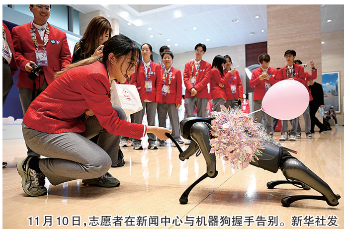
11月10日，志愿者在新闻中心与机器狗握手告别。

新华社上海11月10日电 第七届中国国际进口博览会成交活跃，按一年计意向成交金额800.1亿美元，比上届增长2.0%。