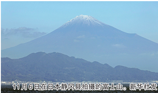
11月6日在日本静冈县拍摄的高山。

和静冈县交界处。山梨县甲府气象台每年宣布富士山“雪顶”出现的时间。虽然媒体和地方政府6日发布“雪顶”