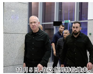
11月6日,在以色列特拉维夫,加兰特被解除职务后抵达记者会现场。

新华社耶路撒冷11月5日电 以色列总理内塔尼亚胡5日晚发表视频声明,他已解除国防部长加兰特的职务,理由是两人之间存在“信任危机”。