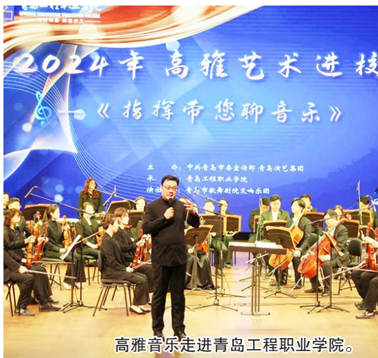
高雅音乐走进青岛工程职业学院。

“高雅艺术进校园·指挥带您聊音乐”音乐会日前在青岛工程职业学院举行。青岛市歌舞剧院交响乐团的音乐家呈现了一场充满艺术激情的演出。在指挥家武晔的带领下，乐团各个声部分别展示了乐器特性、艺术特色和代表曲目，让学子们近距离感受交响乐的魅力。