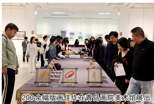
200余幅版画佳作在青岛画院美术馆展出。

来自全国的新锐版画家的200余幅佳作汇聚岛城，展示当代版画艺术的无限可能与创新活力。11月3日，“海纳百川——首届青岛版画新锐展”暨“岁月心痕——青岛画院40年版画回顾展”在青岛画院美术馆拉开帷幕。本次展览由青岛市文学艺术界联合会、市南区委宣传部指导，青岛市美术家协会、市南区文学艺术界联合会及青岛画院联合主办。