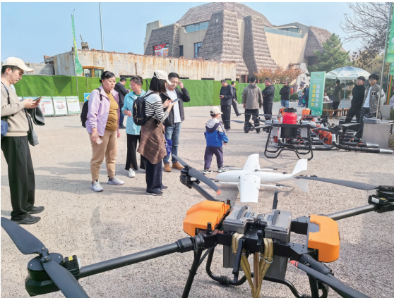
市民游客参观森防设备。