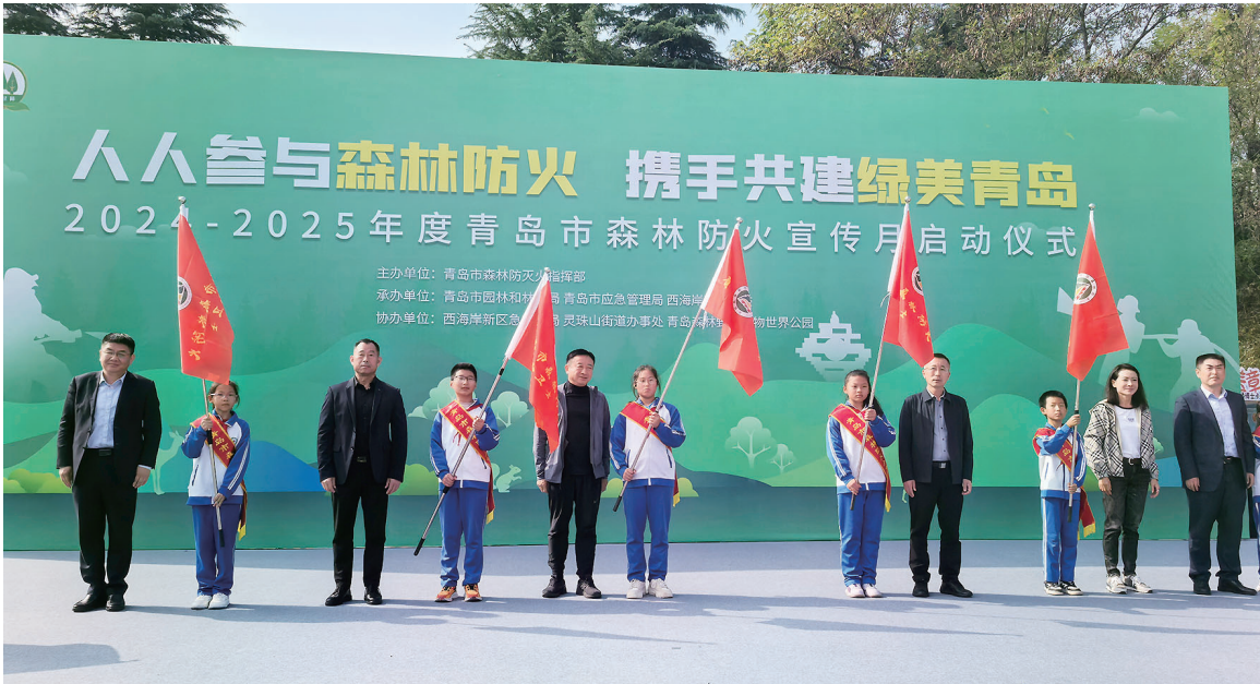
授旗仪式现场。