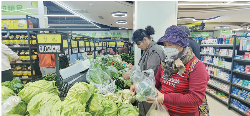
供销社生鲜超市蔬菜品种丰富。

青岛市农业农村局发布的分析10月农产品价格分析报告显示,本月重点监测的42种蔬菜类产品中,平均价格与上月相比,变化幅度在50.25%~20.50%之间。本月西红柿、葱头、冬瓜、青萝卜、土豆价格环比上涨,涨幅分别为20.50%、16.00%、13.82%、8.61%、7.02%;茼蒿、菠菜、油菜、生菜、小白菜价格环比下降,下降幅度分别为50.25%、45.34%、