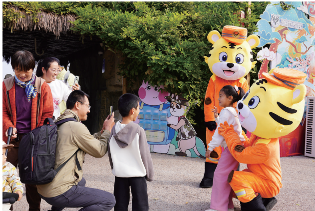
市民游客与森林防火吉祥物虎威威合影。