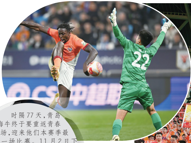
▲海牛即将进行“殊死一搏”。