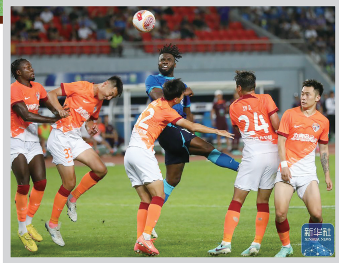
上次较量，海牛战胜沧州雄狮。