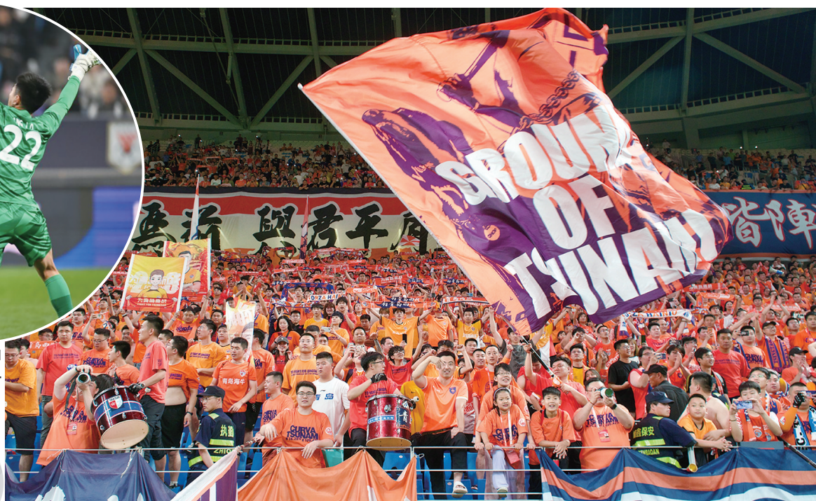
球迷为海牛加油助威。