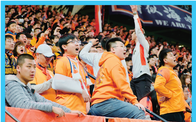
▲球迷为海牛加油助威。

其中，沧州雄狮、青岛西海岸已经基本保级成功，最后一个降级名额将在海牛、梅州以及深圳队中产生。从三支队伍最后一轮的比赛对手来看，梅州客家将面对实力强劲的山东泰山，深圳队将面对已经提前降级的南通支云，而海牛队则面对沧州雄狮。值得一提的是，沧州雄狮主教练李霄鹏虽然是青岛人且曾经执教过海牛队，但沧州理论上仍有降级的可能性，对手恐怕也不会松懈。不过，沧州雄狮在外援奥斯卡单方面离队后，球队状