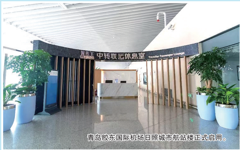
青島胶東国际机场日照城市航站楼正式启用。