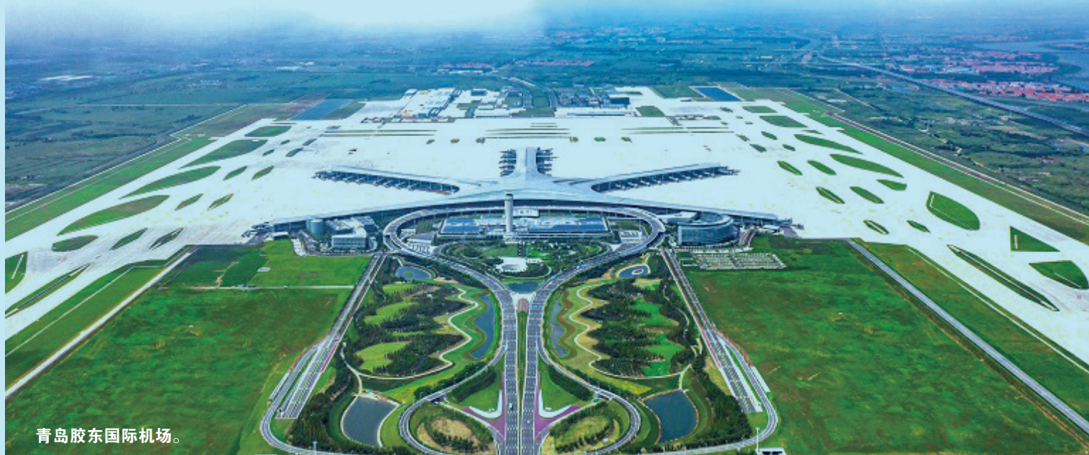
青島胶東国际机场。