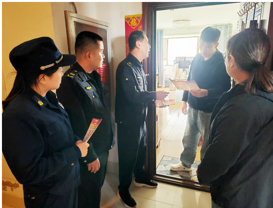
消防等多部门开展“敲门入户”宣传行动。

本报10月30日讯 为切实提高居民安全意识和应对突发事件的能力，普及家庭防火安全知识，有效预防和减少家庭火灾事故的发生，10月28日，城