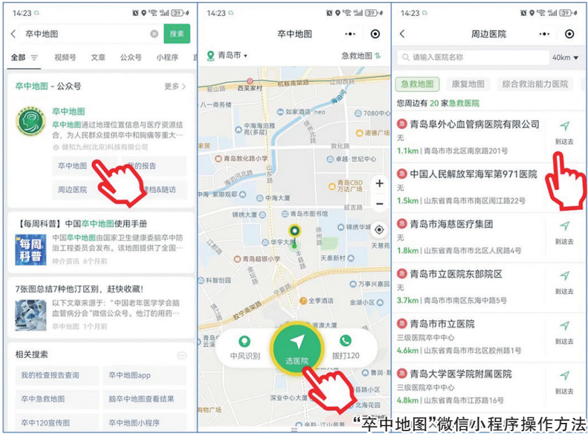
“卒中地图”微信小程序操作方法。

根据《中国心血管健康与疾病报告2022》显示，2019年我国卒中年龄标化患病率为1468.9/10万，与1990年相比，卒中年龄标化患病率上升了13.2%。2024年10月，著名学术期刊《柳叶刀-神经病学》发布研究结果，根