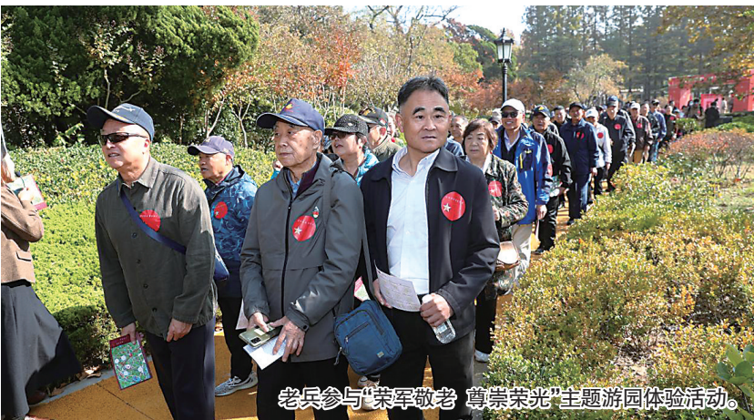
老兵参与“荣军敬老 尊崇荣光”主题游园体验活动。

在“银色能量”区,军休志愿服务队的风采令人动容。他们积极投身社区、开展志愿服务,展现了银龄风采。青岛市军休服务中心今年成立了“荣军银领”志愿服务队,吸引了近200名军休干部加入。