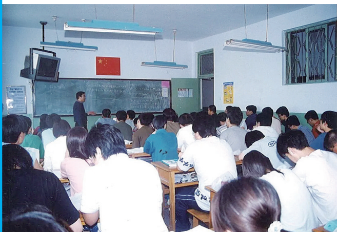
学生们在青岛开放大学大连路校区上课。

40多年前,他们为了提升学历走进开放大学,40多年后,他们又因为对知识的渴求再次走进这所大学。数据显示,自1979年建校至今,青岛开放大学走过了45年的发展历程,为青岛经济社会发展培育高素质实用人才40.245万人,每26个青岛人中就有一位青开毕业生,成为建设学习型社会和终身教育体系的重要力量。