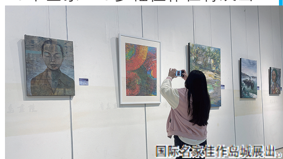
国际名家佳作在青展出。