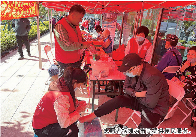
志愿者摆摊为市民提供便民服务。

本报10月20日讯 19日上午，位于市北区欢乐滨海城的青岛滨海国际中心文体广场上热闹非凡，一场充满温暖与活力的公益市集在这里开展。此次活动以“文明实践我行动 倡树美德健康新生活”为主题，吸引了众多市民参与。