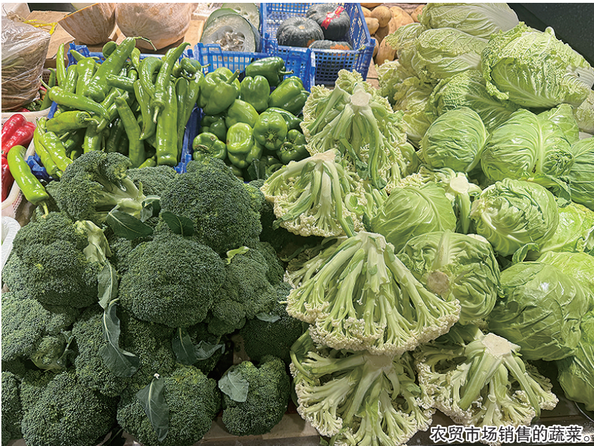
农贸市场销售的蔬菜。

根据青岛市发改委发布的青岛市粮油副食品价格监测情况最新周报显示，蔬菜价格继续下跌。从批发市场情况看，城阳、华中、抚顺路三大蔬菜批发市场蔬菜平均批发价格为3.08元/斤，较前一周下跌4.28%，较上月同期下跌2.68%，较去年同期上涨34.97%。当周批发市场日均上市量为210.93万公斤，较前一周减少6.29%，较上月同期减少3.50%，较去年同期减少3.62%。从零售市场情况看，所监测市内农贸市场19个蔬菜品种平均零售价格为4.77元/斤，较前一周下跌4.79%，较上月同期下跌7.74%，较去年同期上涨31.04%。从具体情况看，19个蔬菜品种价格2涨13跌4平，其中大葱、蒜薹上涨；白菜、芹菜、茄子、西红柿、大头菜、菜花、大葱、萝卜、黄瓜、茼蒿、青椒、芸豆、油菜下跌；韭菜、土豆、胡萝卜、冬瓜持平。