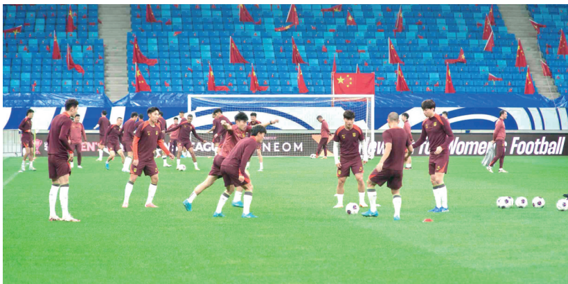
▲国足在青春足球场训练。