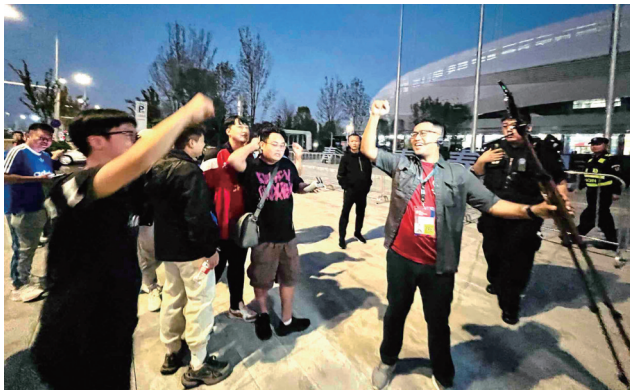
▲球迷在球场外为国足加油。