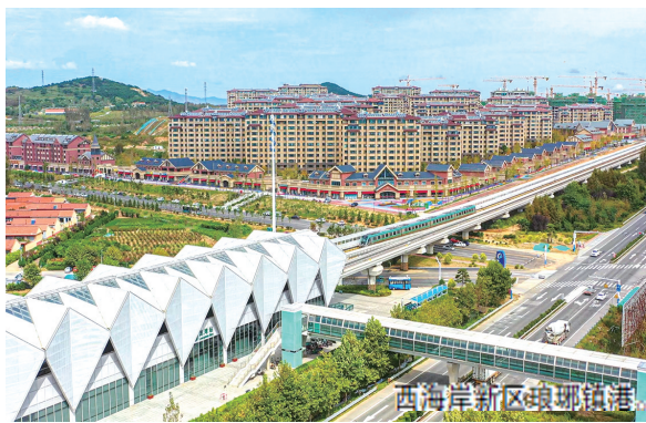
大循环、外围大辐射、区域大联通”的立体交通网络体系基本成形；建设供暖管线琅琊支线主管网，覆盖面积190万平方米；新建两座污水泵站，串联现有农村

规模化污水处理站，污水集中处理率大幅提高。为全面夯实基础设施配套，琅琊镇将重点围绕城镇基础设施扩容谋划实施一批打基础项目，科学评估基础设施支撑能力和公共服务设施供给能力，统筹推进供水供热、地下管网、新能源汽车充电设施布局等基础设施全面延伸覆盖，提升城镇承载力。