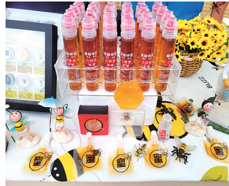
▲便携装樱桃花蜜。 ▲崂山仙菊新鲜可食。

本次活动由北宅街道党工委、北宅街道办事处主办，秉承庆祝丰收、弘扬文化、振兴乡村的宗旨，围绕“农旅融合、乡村振兴”要素，聚焦“农人、农品、农情”，