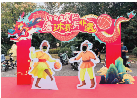
城阳区开设非遗市集迎球迷打卡。