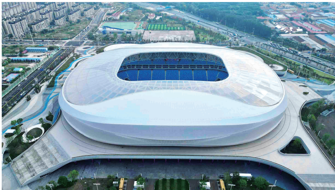
青岛青春足球场。栾丕炜摄

明晚,2026足球世界杯亚洲区预选赛青岛赛区中国队与印度尼西亚队比赛,将在青岛青春足球场打响。作为东道主,青岛已经做好迎接四面八方球迷的准备。今年也恰好是青岛足球发展一百周年,“足球城”青岛届时能否成为国足福地?让我们一起期待。