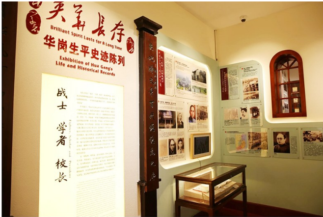
华岗故居内原布设华岗生平事迹陈列展。(资料照片)

城市更新和城市建设三年攻坚行动启动以来，市南区不仅注重历史城区“硬件”的保护更新，同时深挖历史文化