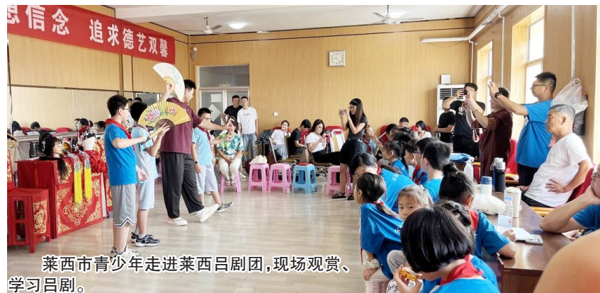
莱西市青少年走进莱西吕剧团，现场观赏、学习吕剧。