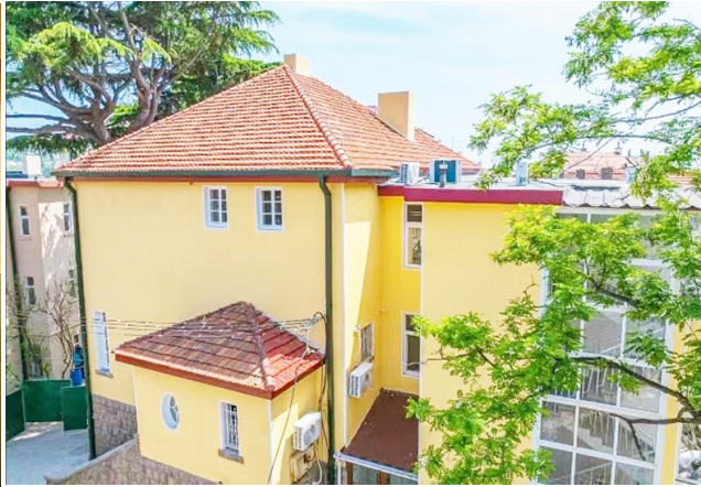
华岗故居位于市南区龙口路40号。(资料照片)

(不含布展)、安装工程等进行提升，并实施室外管网铺设、院墙改造、树木修整等内容；其余建筑包括1号楼、3号楼、传达室的改造提升，其中1号楼建筑面积521.2平方米，3号楼建筑面积445.9平方米，传达室建筑面积38.8平方米，建设内容为结构加固、外立面改造、室内(不含布展)改造、安装工程、室外管网配套工程等。该项目总投资额10520000元，工程造价6051940.98元，招标单位为青岛海明城市发展有限公