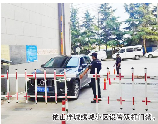
依山伴城绣城小区设置双杆门禁。

本报8月25日讯 近日,位于崂山区中韩街道的依山伴城绣城小区党支部在日常巡查中发现,小区南侧停车场出入口在早晚高峰时段,门禁无法准确识别车辆,导致停车场出入口与新宏路交通严重堵塞。经调查,这是因为车库道闸杆处有部分无信息车辆跟进,导致系统识别出现问题。