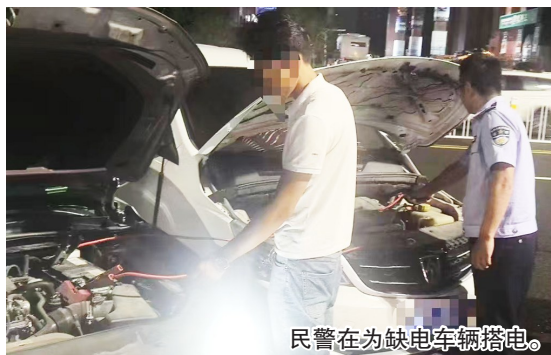
民警在为缺电车辆搭电。

本报8月25日讯 8月24日晚,几名安徽游客的车辆在井冈山路抛锚。几人正着急时,民警及时赶到,帮他们重新启动了车辆。